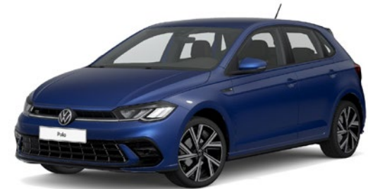
Podvodno modra, kovinski lak 0A