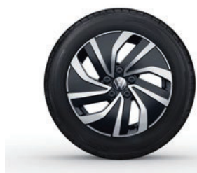
Aluminijasta platišča Essex