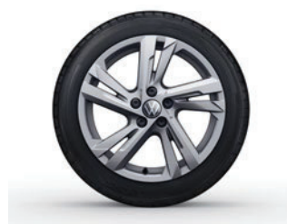
Aluminijasta platišča Valencia