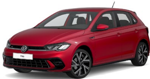
Kraljevo rdeča, kovinski lak P8