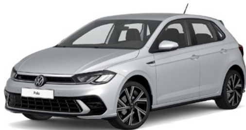
Zrcalno srebrna, kovinski lak 8E