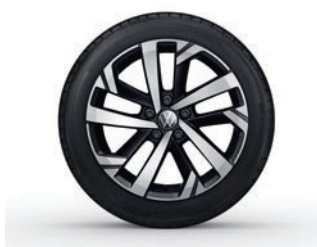
Aluminijasta platišča Torsby