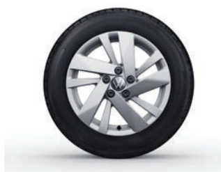
Aluminijasta platišča Ronda