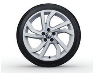
Aluminijasta platišča Tortosa