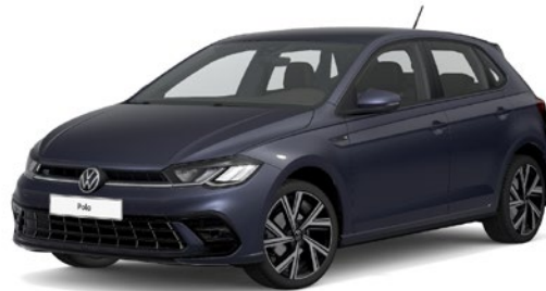
Dimasto siva, kovinski lak 5W