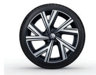
Aluminijasta platišča Bergamo

Nekatera platišča/pnevmatike so naprodaj v omejenem obsegu ali pa v času naročila oz. dobave vozila niso več na voljo. Za informacije o razpoložljivosti platišč/pnevmatik se obrnite na izbranega trgovca in se prepričajte, da ima vaše konfigurirano vozilo tudi želeno dodatno opremo. Naročilo točno določene znamke pnevmatik iz logističnih in proizvodno-tehničnih razlogov ni mogoče. Informacije o oznaki EU za pnevmatike so na voljo v konfiguratorju na spletni strani https://konfigurator.volkswagen.si ali pri izbranem partnerju znamke Volkswagen. Volkswagnova vozila so serijsko opremljena z letnimi pnevmatikami. V Sloveniji je uporaba zimske opreme obvezna v obdobju med 15. novembrom in 15. marcem, pred ali po tem datumu pa v primeru zimskih razmer. Za podrobnejše informacije se obrnite na izbranega partnerja znamke Volkswagen.