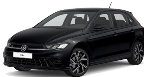
Globoko črna, biserni lak 2T