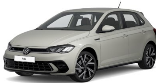
Ascot siva, univerzalni lak 6U