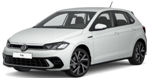
Čista bela, univerzalni lak 0Q