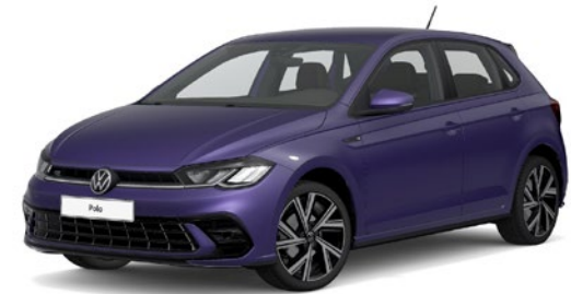
Sijoče vijolična, kovinski lak 7J