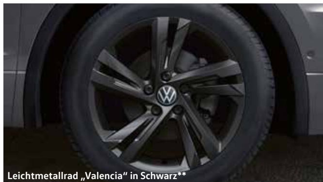
Leichtmetallrad „Valencia“ in Schwarz**