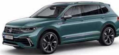
Petroleum Blue Metallic-Lackierung Z3