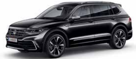
Deep Black Perleffekt-Lackierung 2T