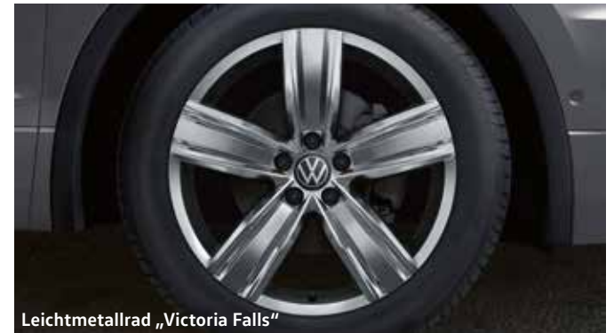
Leichtmetallrad „Victoria Falls“