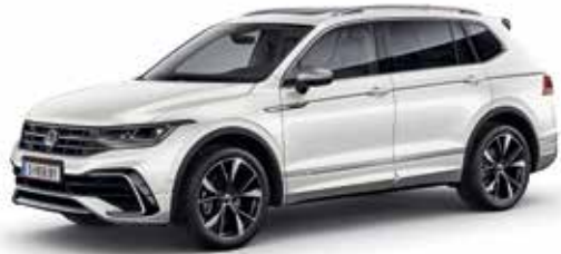
Pure White Uni-Lackierung OQ