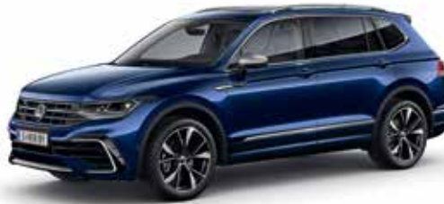
Atlantik Blue Metallic-Lackierung H7