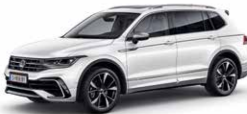
Oryxweiß Perlmutteffekt-Lackierung OR