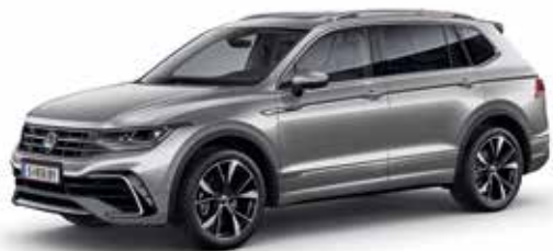
Pyrit Silber Metallic-Lackierung K2