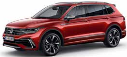
Kings Red Metallic-Lackierung P8