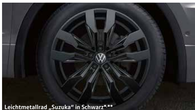
Leichtmetallrad „Suzuka“ in Schwarz***