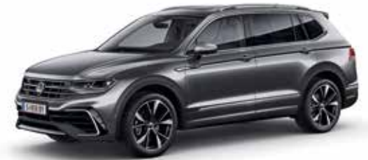
Platinum Grey Metallic-Lackierung 2R