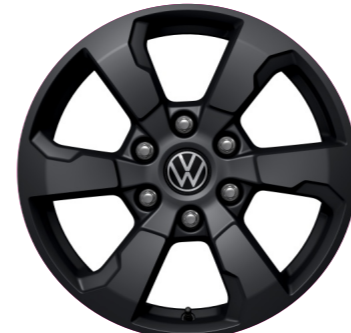
„Amadora” 7.5 J x 18 fekete lakkozású 8

20 colos könnyűfém keréktárcsa (255/55 R 20 110V abroncsokkal) 7