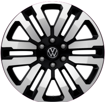
„Varberg” 8.5 J x 21

21 colos könnyűfém keréktárcsa (275/45 R 21 110V abroncsokkal) 7,9