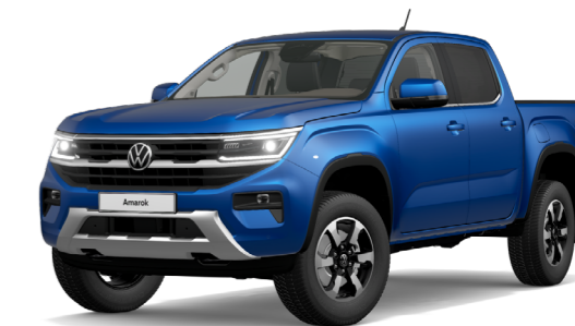
Csillám kék metál