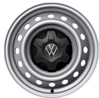
Acél keréktárcsa 7 J x 16

16 colos acél keréktárcsa (255/70 R 16 111T abroncsokkal) 6