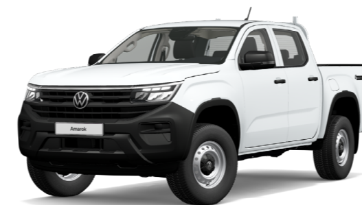
Tiszta fehér szolid fényezés