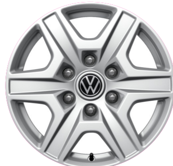
„Combra” 7.5 J x 17

17 colos könnyűfém keréktárcsa (255/70 R 17 112T abroncsokkal) 6