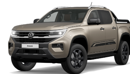
Csillám bézs metál