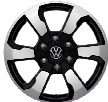
„Amadora” 7.5 J x 18

18 colos könnyűfém keréktárcsa (255/65 R 18 AT abroncsokkal) 7