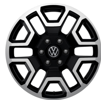
„Bendigo” 8 J x 20

20 colos könnyűfém keréktárcsa (255/55 R 20 110V abroncsokkal) 7