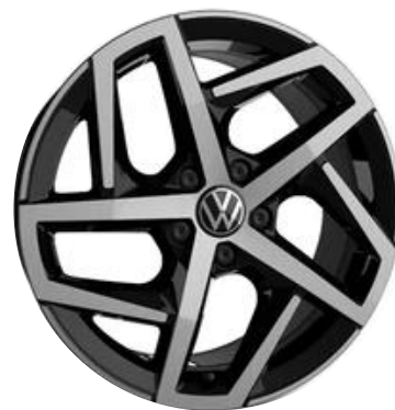
Jantes de liga leve DALLAS 6,5J 225/40 R18"