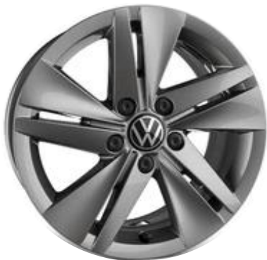
Jantes de liga leve NORFOLK 6,5J 205/55 R16"