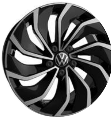
Jantes de liga leve VENTURA 7,5J 225/45 R17"