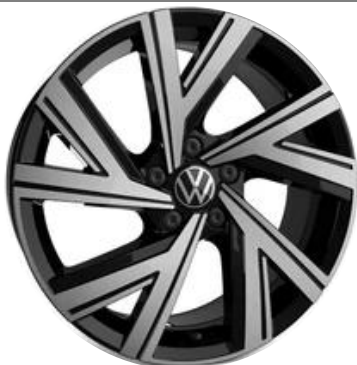
Jantes de liga leve BERGAMO 7J 225/40 R18"