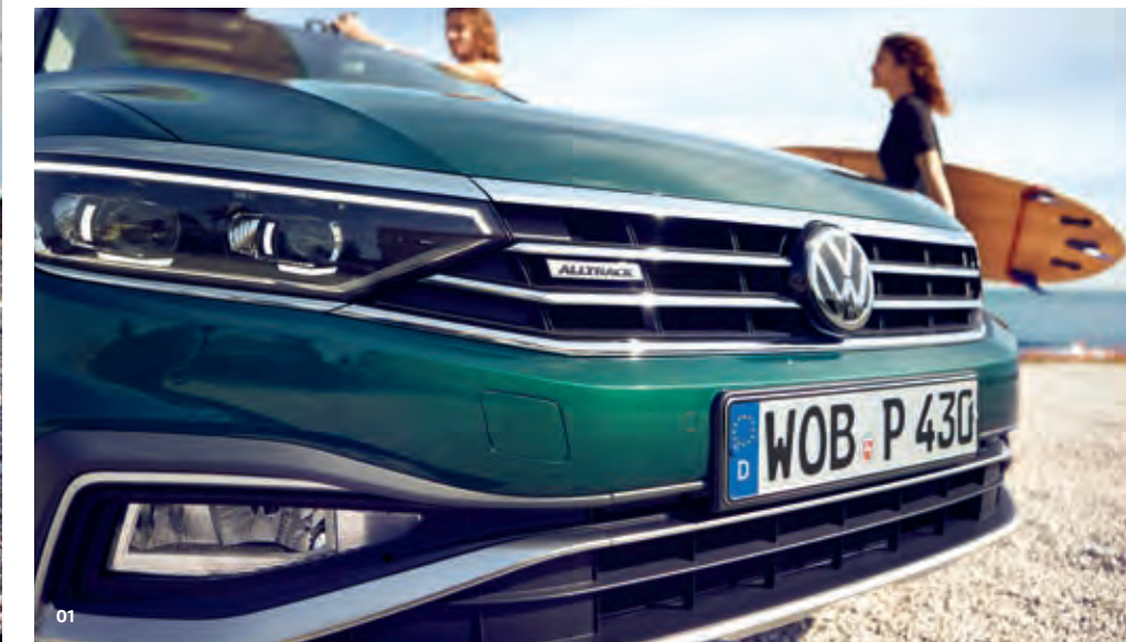
01 Emblema Alltrack de pe grila radiatorului semnaleză tuturor caracterul deosebit, de sportiv, al mașinii, la fel ca și marcanta semnătură C aplicată barei de protecție. S

Noul Passat Alltrack este pregătit pentru agendele pline, dar și pentru provocările spontane, grație tracțiunii integrale 4MOTION și a modului special de condus în off-road. Iar cu funcțiile sale variate de conectivitate, nici conferințele telefonice nu prezintă absolut nicio problemă.